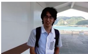
■作品名：「これが新島」 ■Leviathan (立教大学)