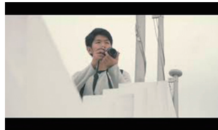
■作品名：#東京新島物語 ~CITY SIDE~ ■TREC Studios (山梨県立大学 × 混合)