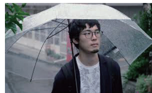
■作品名：式根 晴好雨奇 ■空間映像ゼミナール (早稲田大学)