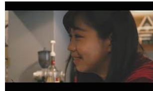
■作品名：#東京新島物語 ~ISLAND SIDE~ ■TREC Studios (山梨県立大学 × 混合)