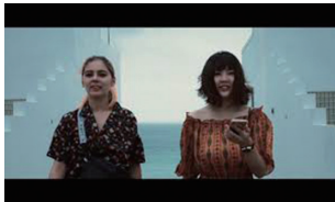
■作品名：New TOKYO ■N4 (日本工学院専門学校)